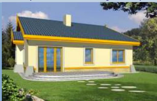
wersja z kalenic prostopadł do wej ciał