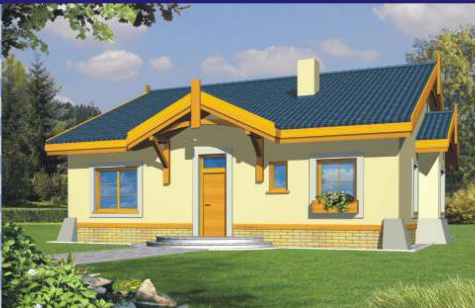
wersja z kalenic równoległ do wej ciał